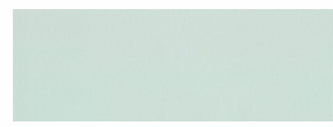
Opaline 011 55 004